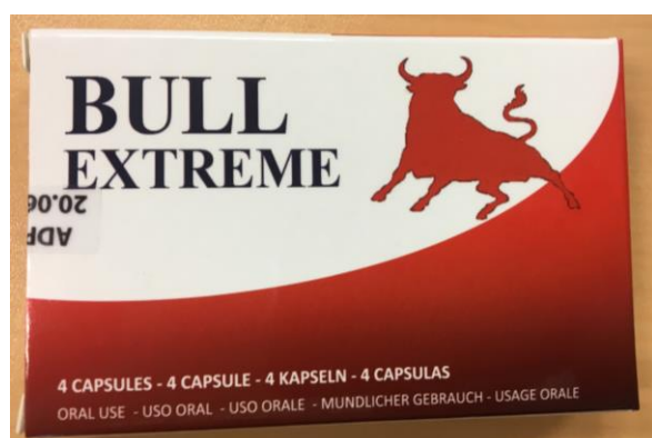
Fig.6: Imágenes del producto BULL EXTREME CÁPSULAS.