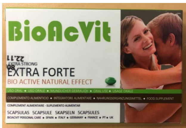
Fig.2: Imagen del producto BIOACVIT EXTRA FORTE CÁPSULAS.