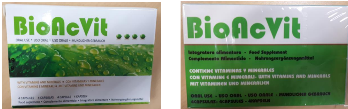
Fig.1: Imágenes del producto BIOACVIT CÁPSULAS .

La información, permanentemente actualizada, de todos los medicamentos autorizados y controlados por la AEMPS está disponible en la web de la Agencia, www.aemps.gob.es , dentro del apartado Centro de Información online de Medicamentos Autorizados (CIMA) .