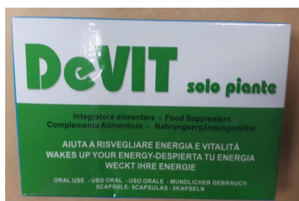
Fig.5: Imagen del producto DEVIT SOLO PIANTE CÁPSULAS.