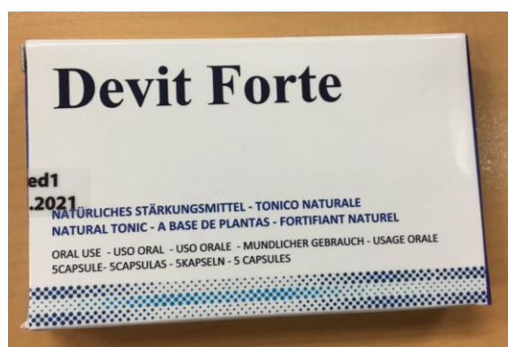
Fig.4: Imagen del producto DEVIT FORTE CÁPSULAS.