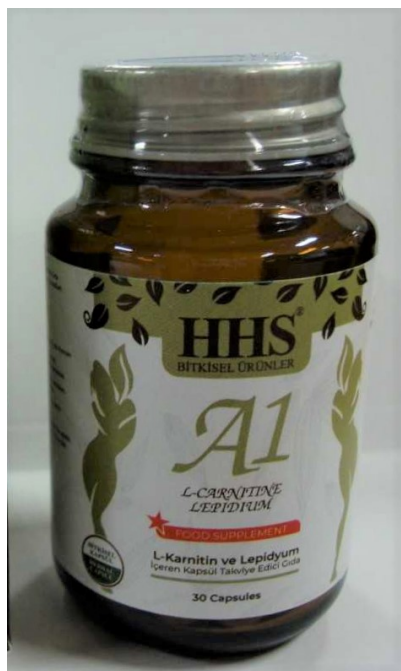
Fig.1: Imagen del producto HHS A1 L-CARNITINE LEPIDIUM cápsulas