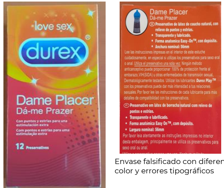
Envase falsificado con diferente color y errores tipográficos