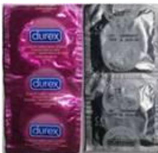
Embalaje primario producto original de color fucsia