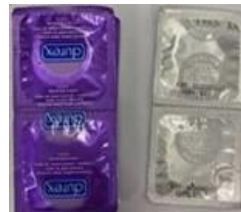
Embalaje primario producto falsificado de color lila