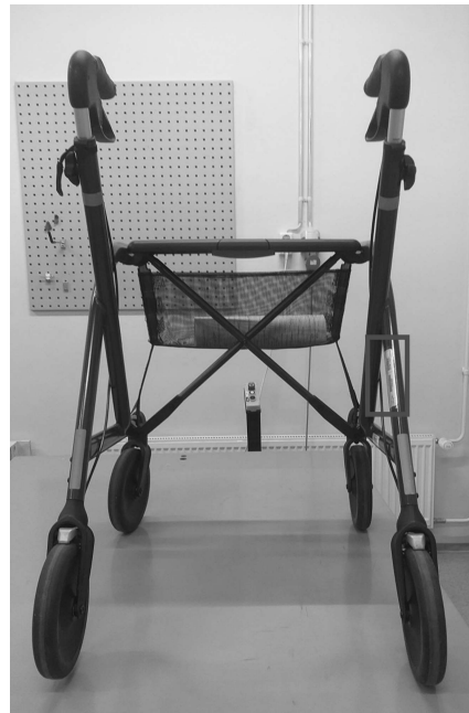
Imagen del andador con ubicación de la etiqueta con información sobre el modelo, fecha de fabricación y n° de serie.